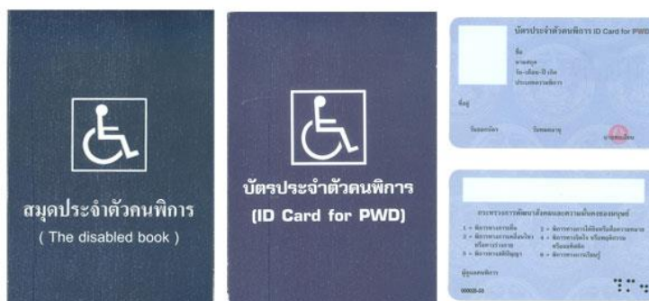
ตัวอย่างบัตรและสมุดประจำตัวคนพิการ

กรณีได้รับเบี้ยยังชีพคนพิการอยู่แล้ว และได้ย้ายเข้ามาในพื้นที่เทศบาลตำบลบ้านต่อม จะต้องมาขึ้นทะเบียนที่ ทต.บ้านต่อมภายในเดือนที่ย้ายมา (ทันที)