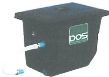
แบบบนดิน