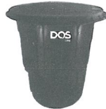
แบบฝังดิน