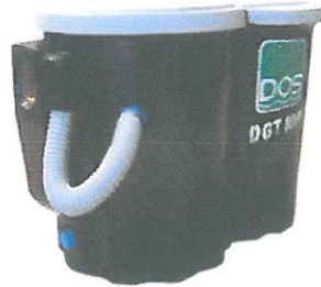
แบบบนดิน