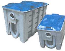
แบบบนดิน