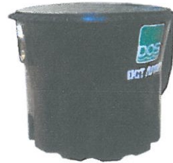
แบบฝังดิน